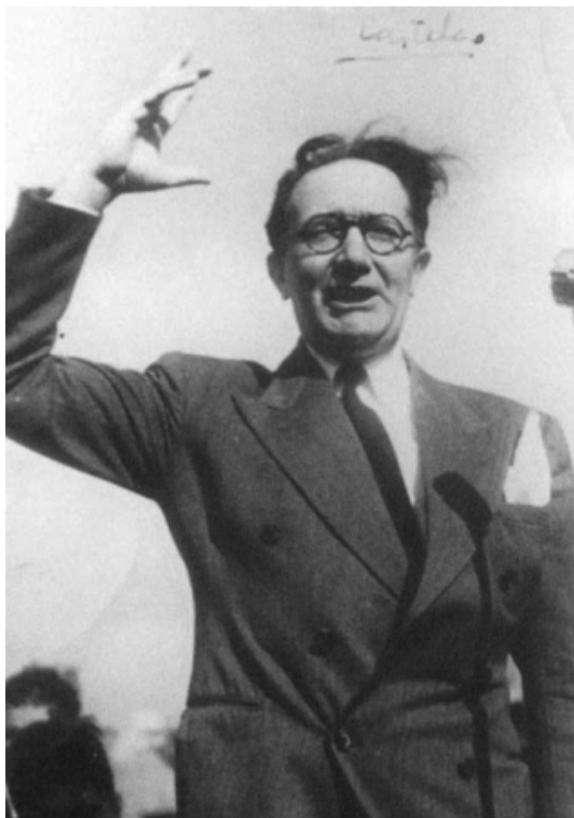
Intervención de Castelao nun acto de Galeuzca Montevideo, 1945

Don Manuel de Irujo durante a viaxe triangular aseguraba que »o problema de resolución máis urxente pra o galeguismo é o ingreso na seición de minorías da Sociedade de Nacións, onde temos de concurrir pra asamblea de Setembro. Isto suporía darlle ao galeguismo unha categoría internazonal e conquistar unha posición ventaxosa pra o día de mañán» .