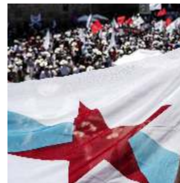
Soberanía e cambio político na Galiza