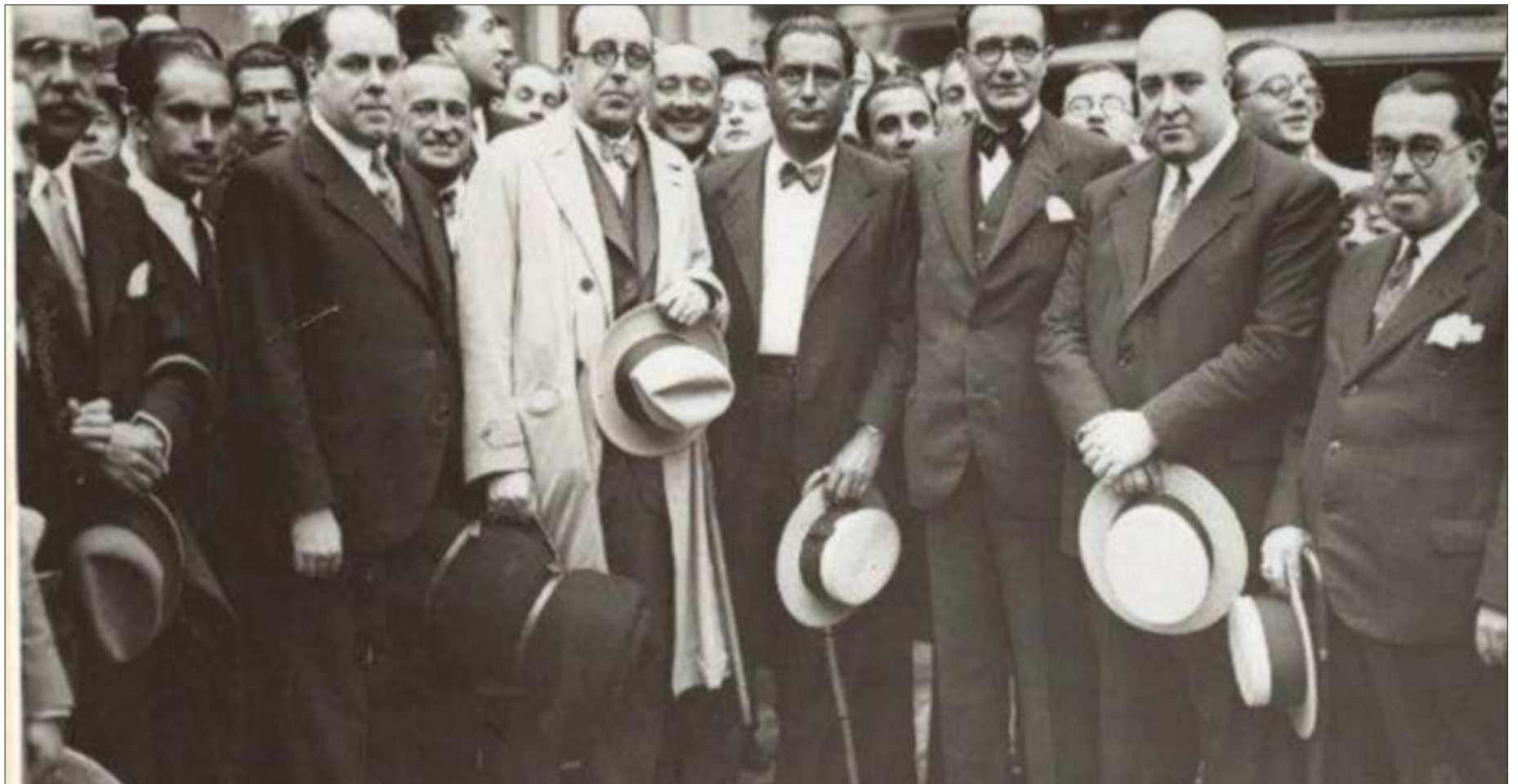
Congreso de nacionalistas galegos e cataláns con presenza de Castelao e Otero Pedrayo

"Pois que somos un povo distinto, debemos selo". Mandato murguiano que aínda nos interpela e nos compromete ás galegas e galegos de hoxe.