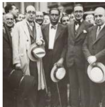
O ingreso de Galiza na Sociedades de Nacións e o Galeuzca