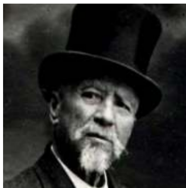
Murguía: A razón da nación galega