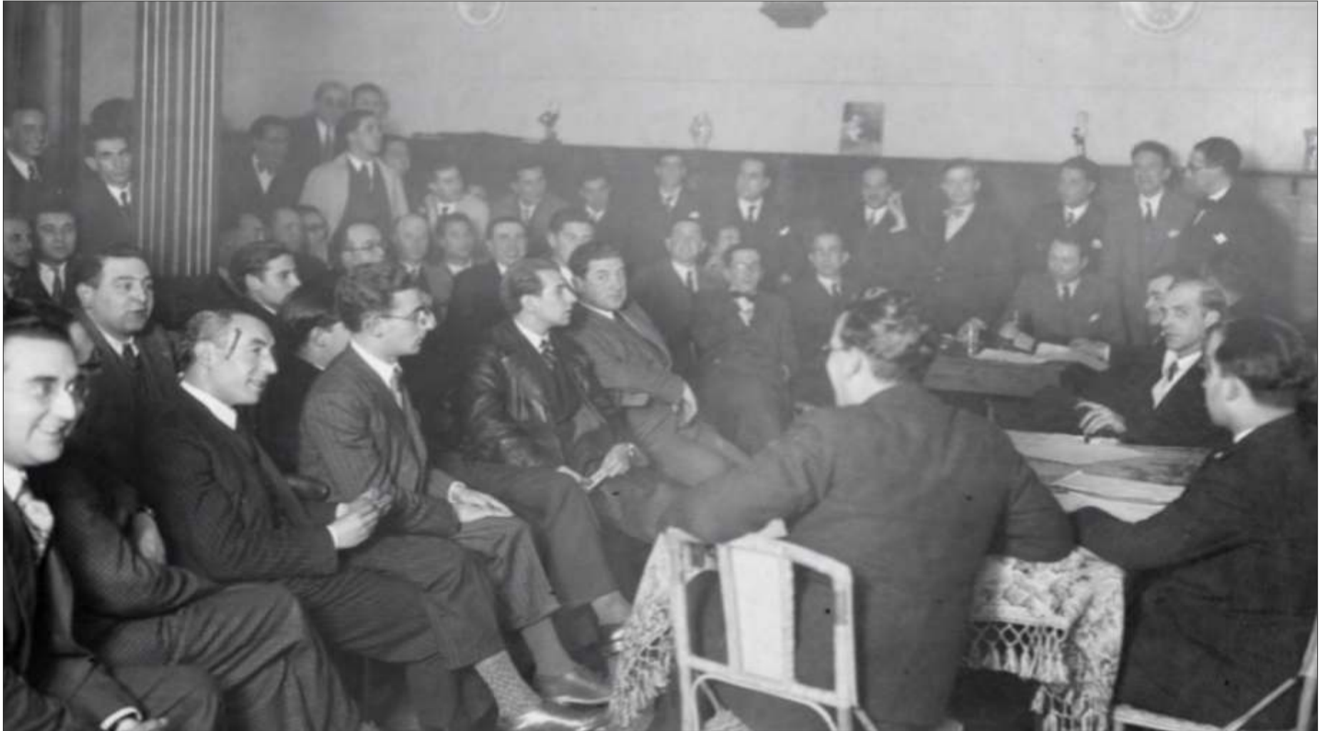
Fundación do Partido Galeguista